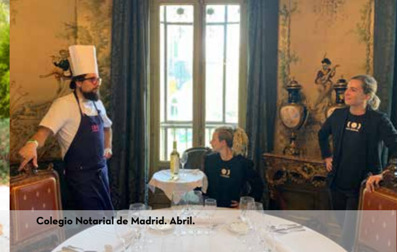
Colegio Notarial de Madrid. Abril.