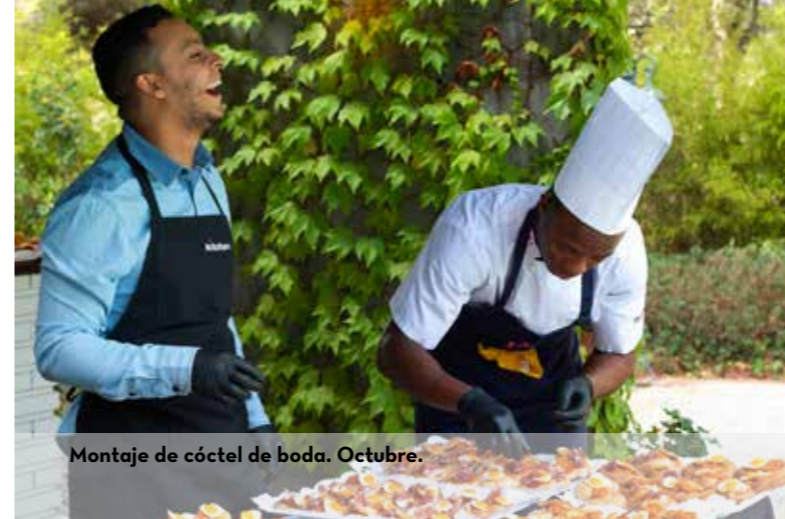
Montaje de cóctel de boda. Octubre.

Cada localización, servicio, cliente... ofrece a los jóvenes un espacio donde mostrar y desarrollar todo su potencial , e imprime en ellos una huella que les permitirá seguir creciendo personal y profesionalmente. Por lo tanto, cada servicio se convierte en una nueva oportunidad de crecimiento para los jóvenes.