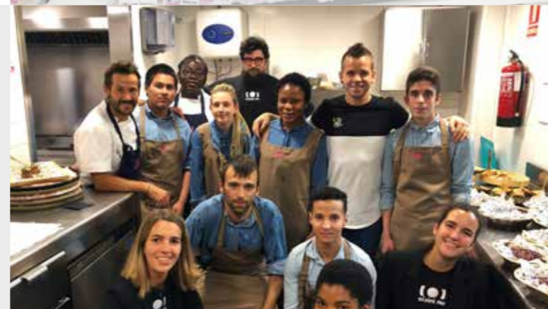
Servicio de catering junto a nuestro padrino Dabiz Muñoz. Mayo.