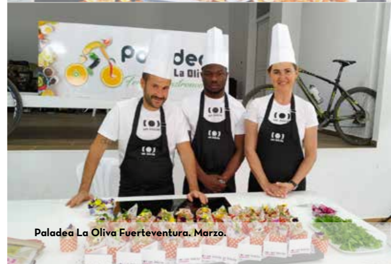
Paladea La Oliva Fuerteventura. Marzo.