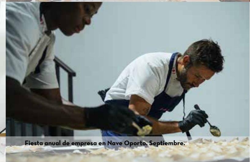
Fiesta anual de empresa en Nave Oporto. Septiembre.