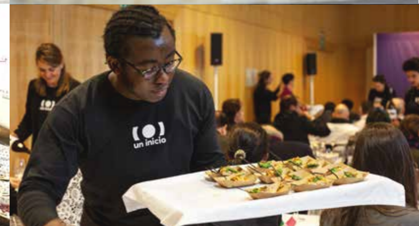
Servicio de maridaje para cata en Enofusión. Enero.