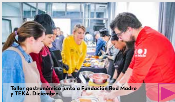
Taller gastronómico junto a Fundación Red Madre y TEKA. Diciembre.