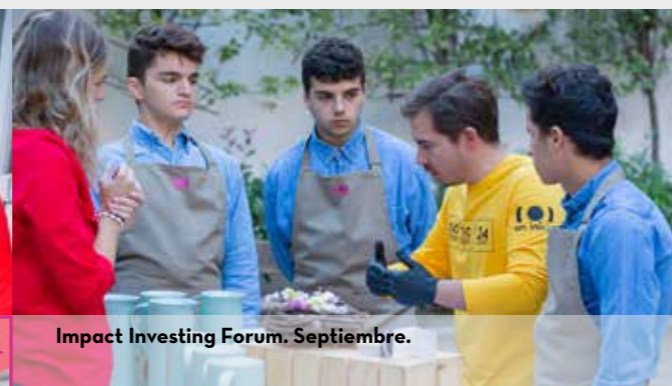
Impact Investing Forum. Septiembre.